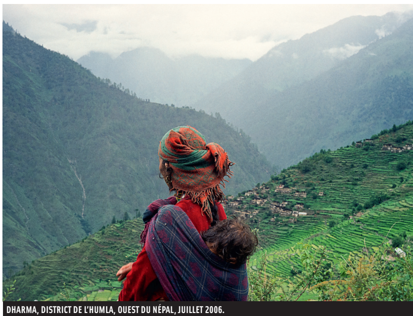
DHARMA, DISTRICT DE L'HUMLA, OUEST DU NÉPAL, JUILLET 2006.